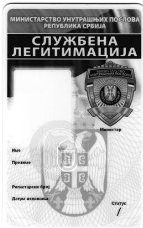
Образац службене легитимације за државног службеника