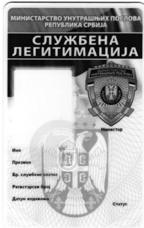
Образац службене легитимације за полицијског службеника (предња страна)