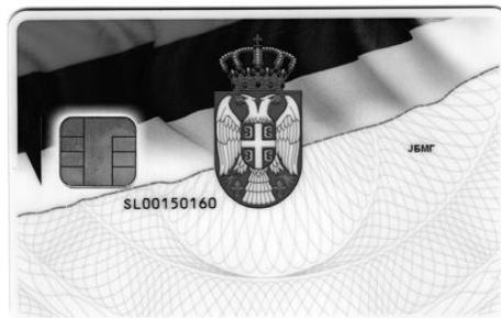
Образац службене легитимације (полеђина)